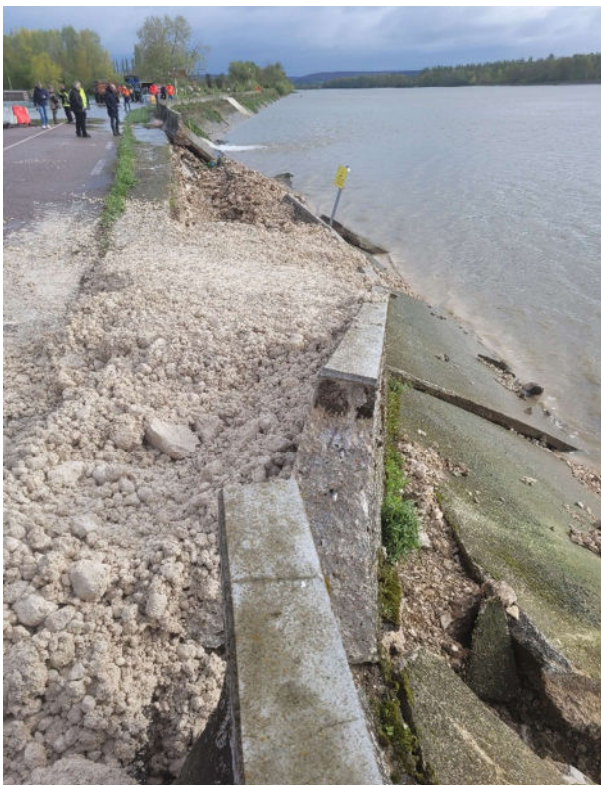
Rupture de la digue entre Mauny et Bardouville le 9 avril 2024.

Ce chantier représente un enjeu de sécurité majeur, tant pour la protection contre les inondations que pour la fiabilité des infrastructures routières. Le SMGSN et le Département remercient les riverains et les usagers pour leur compréhension et leur patience durant cette période de travaux.