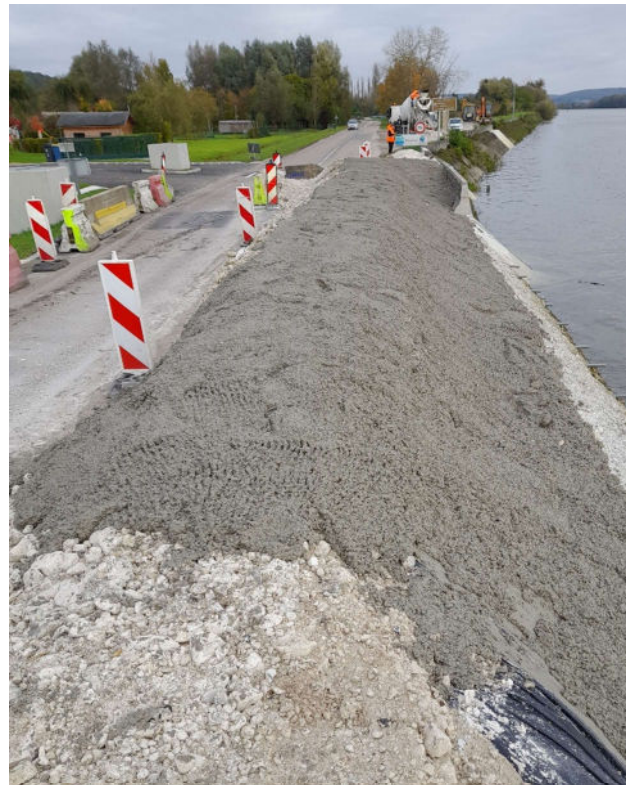
Ouvrage temporaire pour sécuriser les habitants du hameau le temps de réaliser les diagnostics préalables aux travaux de reconstruction